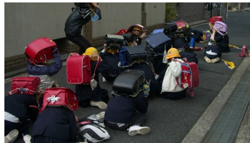
通学路での地震対策訓練の様子

内膳町防災会総会が平成 30 年 4 月 14 日にすみれホールにて午前 10 時から開催されました。約 60 名の参加者が午前 10 時前に参加されて平成 29 年度の活動報告、会計報告、同監査報告、本年度の防災会役員名公示、事業計画、予算案が説明され、承認されました。