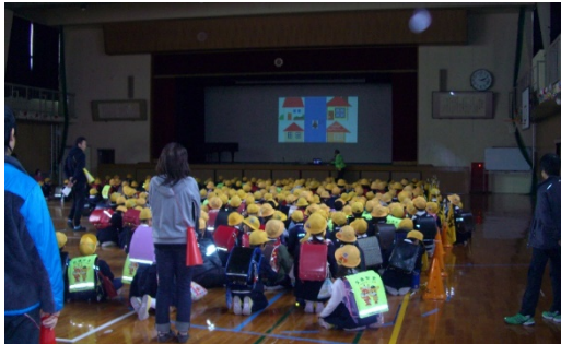
体育館での全体訓練説明

我々住民が地震災害時にとるべき行動と全く同じもので、災害時に取る行動訓練になりました。来年も内膳町防災会は学童訓練に協力参加します。