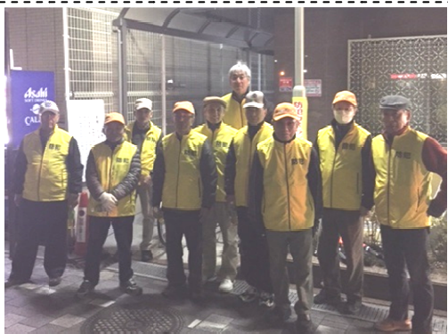
町の安心安全を守るパトロール隊

八木駅前交番の協力を得て、自治会と防災会が協同で行っている夜間パトロールは4年を経過しました。当初は月1回（毎月20日前後）でしたが、安心安