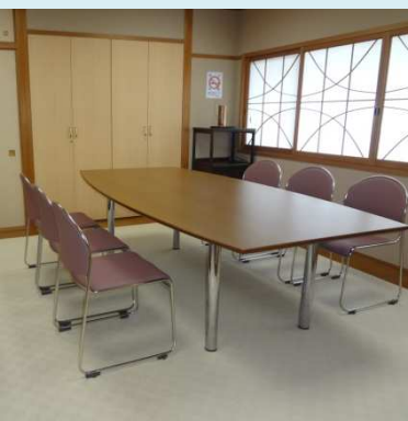
洋室仕立てになった1階和室

一階和室を洋室に改装しました 会館の所在が広まるにつれ、最近は各室が多種多様な会議や趣味の集りに利用されています。今後もこの傾向が続くと考えられることから、今般、財産管理運営部会ではより多くのの方に効率良く会館を利用して頂くために、これまで葬儀が行われる際の帳場に使用される以外にはほとんど外部に貸すことがなかった一階入口右横の和室（10畳・10人用）を洋室に改装した上で、部屋貸しすることを提案。同案件が一月の役員会で承認