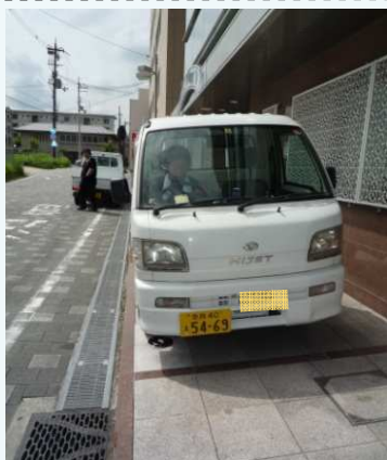
車の駐車した状態

内に駐車出来るようになり、また（写真下）。車止め同士を鎖で繋ぐことはありませんが、自転車の通行に支障をきたすことがありました。照明LED化については、昨年の1、2階に引き続き全館の照明がLED化されたため、電気代だけでなく電球取替の頻度が少なくなり、会館運営費用の低減が期待されます。