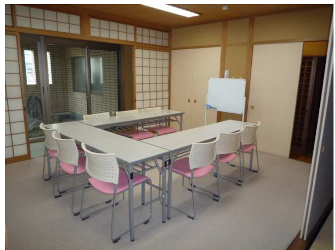
少人数の集りにご利用ください

すみれホールを会議や趣味の教室として使用される件数が増えています。平成25年度は156.5万(前年比116%)の収入がありました。部屋の