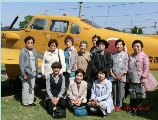
石川県航空博物館にて

善寿会恒例の一泊旅行は5月19日・20日、23人が参加、名湯として知られる北陸加賀温泉郷の一角をなす「山中温泉」への旅を楽しみました。